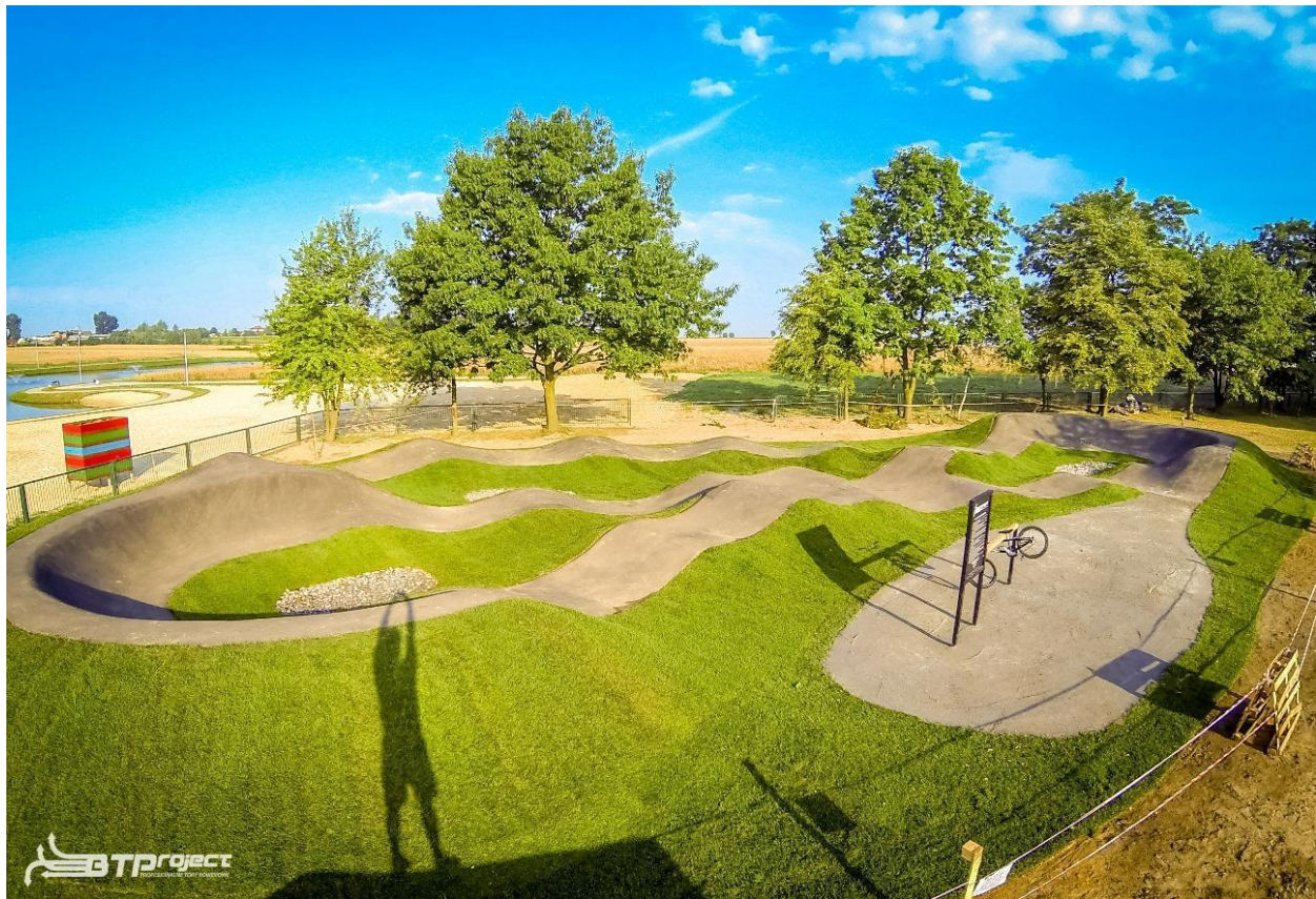
Przykładowa realizacja (Raszków, Polska)

- Pumptrack łączy ludzi i umożliwia współtętnienie w otoczeniu na tolerancji i aktywności.